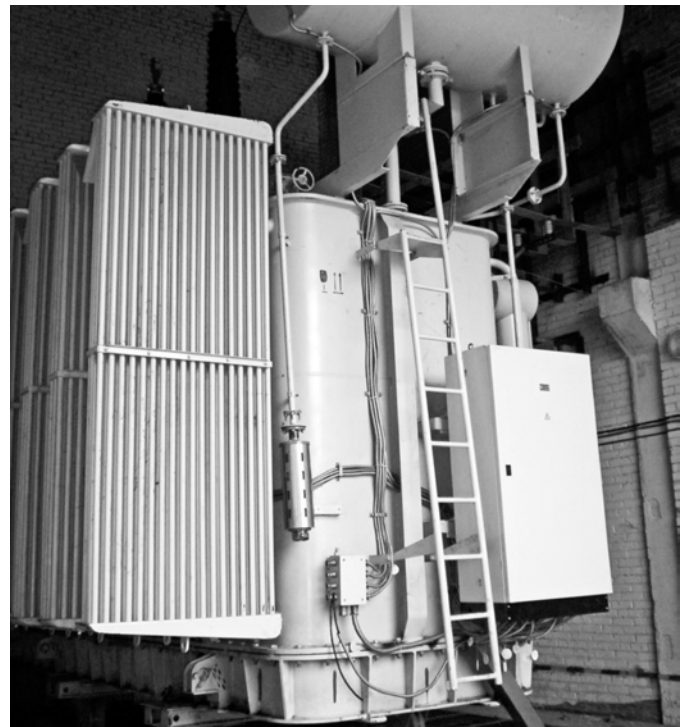
Монтаж силового трансформатора на подстанции «Вымпел» (Восточные электрические сети)